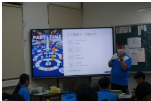
運用遊戲的形式讓學生更投入課程，說明闖關遊戲的玩法