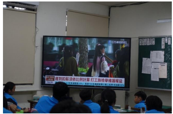
觀看最近新聞影片實例，讓學生能 更了解勞動法規