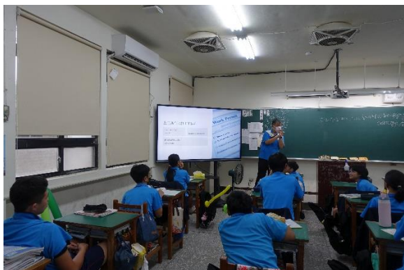
老師透過問答帶領同學複習公民課學過的需滿幾歲才能打工