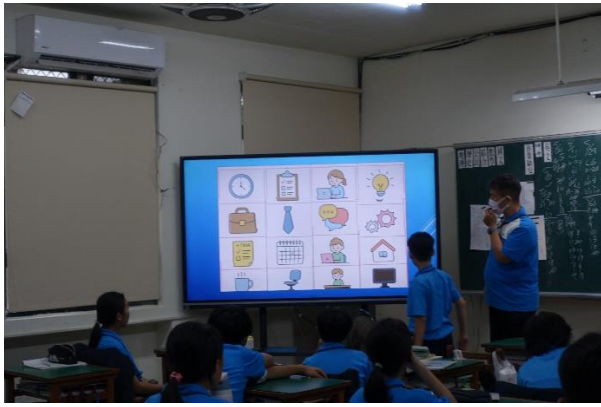
遊戲中讓學生選擇題目